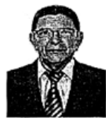
Neto dos Corredores